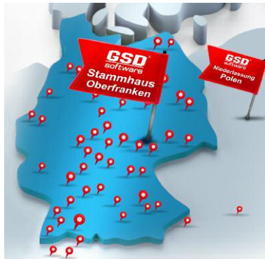
Regionale Stärke – überregionale Präsenz: GSD Software hat neben dem Hauptsitz in Stockheim derzeit europaweit über 50 Vertriebspartner.

Heute schätzen Anwender aller Branchen die hohe Flexibilität der Software und den Vorteil, umfassende betriebswirtschaftliche Lösungen aus einer Hand zu bekommen. GSD Software zählt zu den führenden Anbietern auf dem Gebiet von Dokumentenmanagement (DMS)-, Kundenbeziehungsmanagement (CRM)- und ERP-Softwarelösungen in Deutschland. Mehr als 35.000 Anwender im In- und Ausland haben sich für GSD Software entschieden. Bereits im Standard bietet das System umfassende Funktionalität auf höchstem Niveau. Dank einer eigenentwickelten Programmiersprache ist es in der Lage, innerbetriebliche Prozesse innerhalb kürzester Zeit abzubilden und sich flexibel den unterschiedlichsten Anforderungen anzupassen.