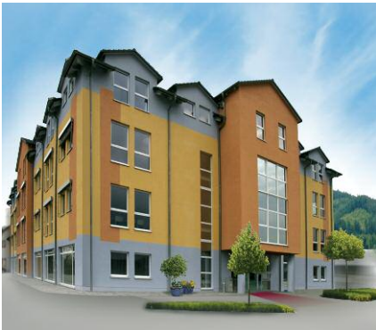
Eindrucksvoll vereint: GSD Softwareentwicklung, Schulungszentrum und stilvolles 4-Sterne Business- und Wellness-Hotel mit mediterranem Restaurant.