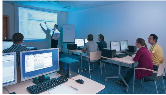
Auf dem neuesten Stand: Für Workshops und Schulungen stehen acht Seminarräume mit modernster Technik bereit.

GSD Software wurde im Jahr 2010 unter die TOP 100 der innovativsten Mittelständler Deutschlands gewählt und mehrmals mit dem begehrten Innovationspreis der Initiative Mittelstand ausgezeichnet. Durch permanente Weiterentwicklung der Produkte will GSD Software auch in Zukunft innovative Maßstäbe im Sinne seiner Kunden setzen.